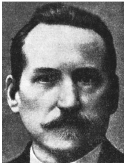
Рис. 1. Андрій Гонька (Gońka) (1857–1909).

Доктор Андрій Гонька (Gońka) (рис. 1) – професор львівського університету (з 1902 р. – доцент стоматології, з 1909 р. – професор стоматології), перший керівник курсу стоматології на медичному факультеті львівського