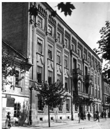
Рис. 4. Будинок клініки стоматології львівського університету на вул. Оссолінських, тепер – В. Стефаніка (вигляд на час відкриття поліклініки).

З наукових праць відомі такі: «Про знечуження шкіри кокаїном під впливом електричного струму» (часопис «Лікарський огляд», 1899); «Про кон'югаційну теорію Монгерштерна» (часопис «Лікарський огляд», 1900); «Про виділення і склад слини привушної залози під впливом різних чинників» (часопис «Лікарський огляд», 1900); «Про утворення кіст слизової оболонки ясен» (часопис «Польський архів біологічних і медичних наук», т. 1, 1901); «Про так звані силікатні пломби» (часопис «Огляд дентистичний», Варшава, 1904); «Гіперемія пульпи в клінічному розумінні» (часопис «Львівський лікарський тижневик», 1906); «Про роль фосфору в організації субстанцій кістки і зуба» («Пам'ятка X з'їзду лікарів і природників Польщі», 1907); «Який метод лікування некрозу пульпи і кореневих каналів дає найкращі результати?» (часопис «Львівський лікарський тижневик», 1907); «До питання патогенезу альвеолярної піореї» (часопис «Львівський лікарський тижневик», 1907); «Про пломби з порцелянових цементів» (часопис «Львівський лікарський тижневик», 1907); «Про кремнієві пломби» (часопис «Хроніка дентистична», Варшава, 1908), «Цікавий випадок протоки