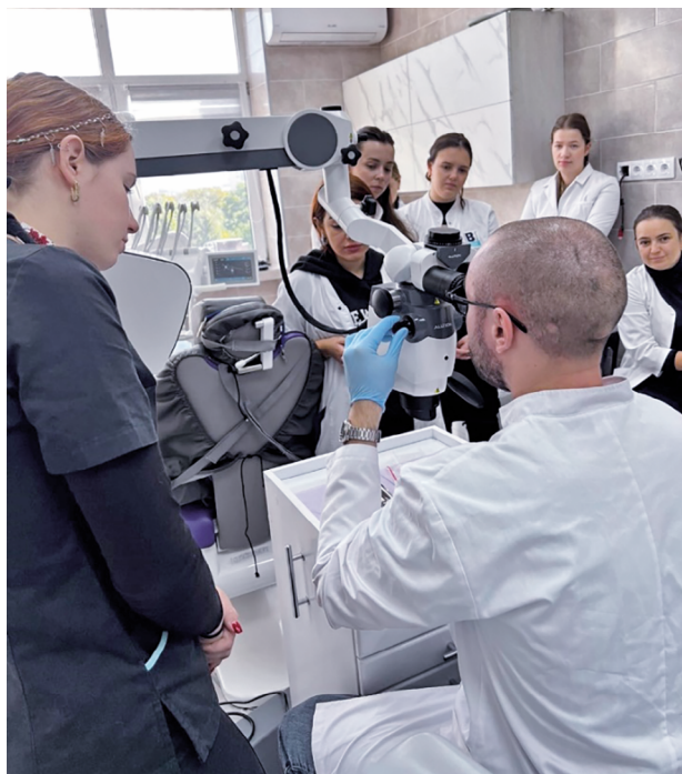
Рис. 1. Навчальний процес на кафедрі стоматології ІПО НМУ імені О. О. Богомольця

Співробітники кафедри надають весь спектр стоматологічної допомоги пацієнтам, зокрема ортопедичної, терапевтичної дорослої та дитячої, дитячої хірургічної стоматології, ортодонтії, пародонтології. Слід зазначити, що весь комплекс стоматологічної допомоги на базі стоматологічного медичного центру НМУ для дітей-сиріт та воїнів ЗСУ надається безплатно. На даний час співробітники кафедри стоматології проводять безплатну санацію дітей-сиріт та дітей, позбавлених батьківського піклування. Наприклад, 7 грудня співробітники кафедри стоматології відвідали Київський обласний центр соціально-психологічної реабілітації дітей «Сезенків», що у Бариськівському районі Київської області. Окрім святкової програми із врученням подарунків для дітей-сиріт, фахівці НМУ, професійні лікарі-стоматологи провели профілактичний стоматологічний огляд вихованців Центру та майстер-клас по догляду за зубами та порожниною рота. Відтак за ініціативи та підтримки ректора НМУ Юрія Кучина вихованців центру соціально-психологічної реабілітації лікуватимуть у Стоматологічному медичному центрі нашого Університету. Нині на вихованні у Київ-